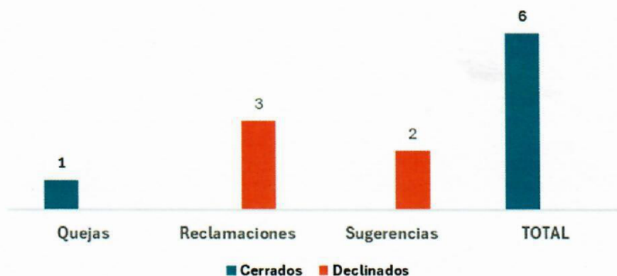
Gráfico de casos Sistema 3-1-1 Correspondiente al año 2024

Durante el año 2024, fueron recibidas 1 queja, 3 reclamaciones y 1 sugerencia, para un total de 6 casos, de los cuales 5 fueron tipificados como casos declinados por no pertenecer a nuestra institución. Siendo sólo un caso atendido y cerrado fuera de plazo por cambios de gestión. Del mismo modo, se informa que, a través del Buzón Físico, no se reportaron casos durante el año 2024.